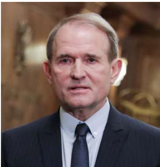
Kaum einen Monat nach der Gründung des CCD wurde Wiktor Medwedtschuk, Vorsitzender der „Oppositionellen Plattform -Für das Leben“, die bei den Wahlen 2019 über 13% der Stimmen erhielt, verhaftet und wegen Hochverrats angeklagt. (duma.gov.ru)

Kaum einen Monat nach Gründung des CCD wurde Wiktor Medwedtschuk, der Vorsitzende der Oppositionspartei Plattform für das Leben, die mit über 13% der Stimmen bei den Wahlen 2019 eine bedeutende Kraft im Parlament ist, verhaftet und des Hochverrats angeklagt. Präsident Selenskyj rechtfertigte den Schritt mit einer ominösen neuartigen Formulierung: Die Ukraine müsse „die Gefahr einer russischen Aggression in der Informationsarena bekämpfen“.